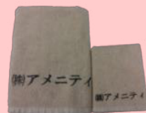
バスタオル フェイスタオル