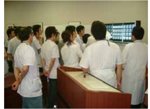
CCCの様子(平成19年6月12日)

8 月 CCC は休会ですが、次回第 8 回を、10 月 9 日 (火曜日) に「がん治療での病-診連携」をテーマに開催予定です。次回は開業の先生にも、ご発表いただきたいと考えております。診断や治療法が進み、種々の癌での地域的連携が益々重要視される時代となってきております。最前線で医療を担っておられる地域の先生方には、当 CCC にご参加いただき、癌の早期診断と継続的治療への取り組みに、今後ともご協力いただければ幸いです。次回も、多くの先生方のご参加をお待ちしております。