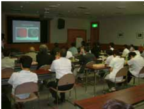
CCCの様子(平成19年6月12日)